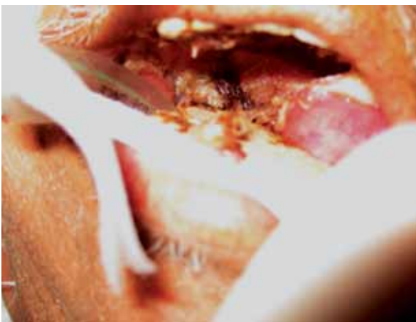
Figura 2. Lesión ulcerada y necrótica en el paladar duro y blando derechos. Mucormicosis.

Al examen físico: presión arterial, 150/90 mm Hg; frecuencia cardíaca, 80/min; frecuencia respiratoria, 18/min; temperatura, 37 °C.