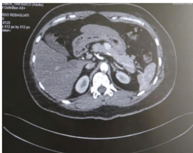
Figura 1. TC dinámica: lesión hipervascularizada en el cuerpo del páncreas en la fase arterial precoz.

Paciente mujer de 43 años de edad con infección por VIH desde hace siete años y con tratamiento de lamivudina, tenofovir, atazanavir. Tres años antes de su ingreso empezó a presentar palpitaciones, sudoración, somnolencia, de predominio matutino, y que los síntomas mejoraban con la ingestión de alimentos dulces. Hace dos años después presentó, mientras dormía, un episodio convulsivo que duró dos minutos, cediendo espontáneamente y en el estado postictal mejoró con la ingestión de alimentos dulces. Al presentar otros episodios similares, con una RMN normal, en neurología, se le inició tratamiento con fenitoína y se agregó, después, fenobarbital por persistencia de las convulsiones; y, observó que con el aumento de la cantidad y frecuencia de alimentos disminuyeron los episodios convulsivos. Un año antes del ingreso, en consulta ambulatoria de infectología, presentó glicemia en ayunas de 46mg/dl y fue referida a endocrinología para estudio.