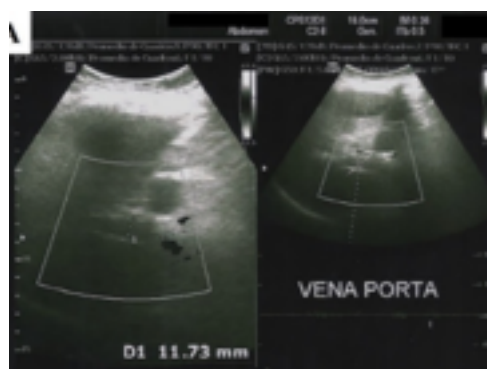
Figura 2. Ecografía Doppler de vena porta con ausencia de flujo, sugestivo de trombosis portal.