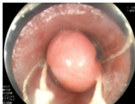
Figura 1. Endoligadura de vórices esofágicas

Durante la hospitalización completó el tratamiento con octreotide por cinco días sin evidenciarse nuevo episodio de sangrado digestivo. Se revisó la historia clínica de