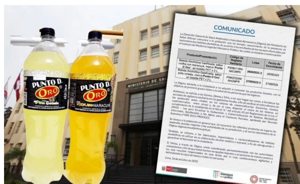
Figura 1. Punto D. Oro.

En el Servicio de Emergencia del Hospital Nacional Arzobispo Loayza, del 1 de enero de 2007 al 31 de octubre de 2022, se han atendido 42 pacientes intoxicados por metanol (Figura 2), con un aumento en el 2020 con 8 pacientes, coincidiendo con la adulteración del alcohol medicinal y alcohol gel durante la pandemia COVID-19; y, el otro incremento en este año con 15 pacientes (2 en setiembre y 10 en octubre, de los cuales 2 fallecieron, debido al consumo de la bebida adulterada ya descrita.