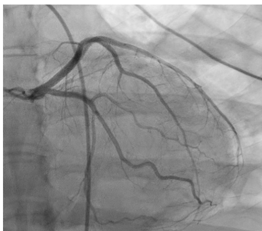
Figura 3. Arteriografía coronaria izquierda: arterias de calibre y distribución normal, sin evidencia de lesiones oclusivas. Patrón coronario derecho.

inmunitaria que lesiona el músculo cardíaco produciendo una miocarditis. 10 Otra es que la MCPP es causada por un desequilibrio hormonal secundario al estrés oxidativo, produciendo un aumento en la hormona prolactina y la formación de una subforma de 16 KDa, la cual posee un potente efecto antiangiogénico, proapoptótico y proinflamatorio que afecta a las funciones del endotelio, la vasculatura cardíaca y el miocito cardíaco, que conduce a una disminución en la función del corazón. 11 Reforzado por niveles elevados de tirosina quinasa 1 similar a fms soluble (sFlt-1), un potente inhibidor del factor de crecimiento endotelial vascular, que ha sido implicado en la patogénesis de la preeclampsia, lo que sugiere una superposición entre estas condiciones. 11-15 Una tercera teoría es que la MCPP es causada por una predisposición genética, ya que existe una mayor incidencia de MCPP en mujeres que tienen antecedentes familiares de miocardiopatía dilatada familiar. 16